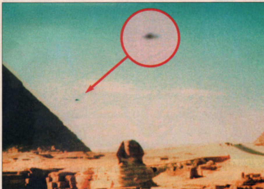
1981. november 18-án fotózott ufó a Nagy Píramisnál

szintén az atomenergia szakszava magyarul. Az atomenergia használata közben már a régi időkben is léteztek atomkatasztrófák. Elk űr-ős is ilyen katasztrófa áldozata lett, aki a világűrbe való második visszatérésekor atomégést szenvedett, és a Tonikon hegyre zuhant vissza. A szerencsétlenség miatt irányítatlanná váló magfúzió során a hegytető megolvadt, és a görög szigetvilágra tüzeső hullott, mely elpusztította a szigetvilág összes lakosát teljes kultúrájával együtt. A hegytető új neve égető-ki = égetőföld lett, amit ma Agtika = Attika