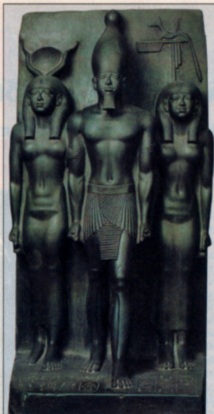
Menkauré fáraó balján Hathor istennő, jobbán Felső-Egyiptom patrónusa

A CD-re is – mint adathordozóra – találhatunk bizonyítékokat éppen a már említett minoszi kultúra földjéről, gondolkodjunk itt például a görög Fesztoszra. Ezen a területen találták a korong alakú, spiráli-