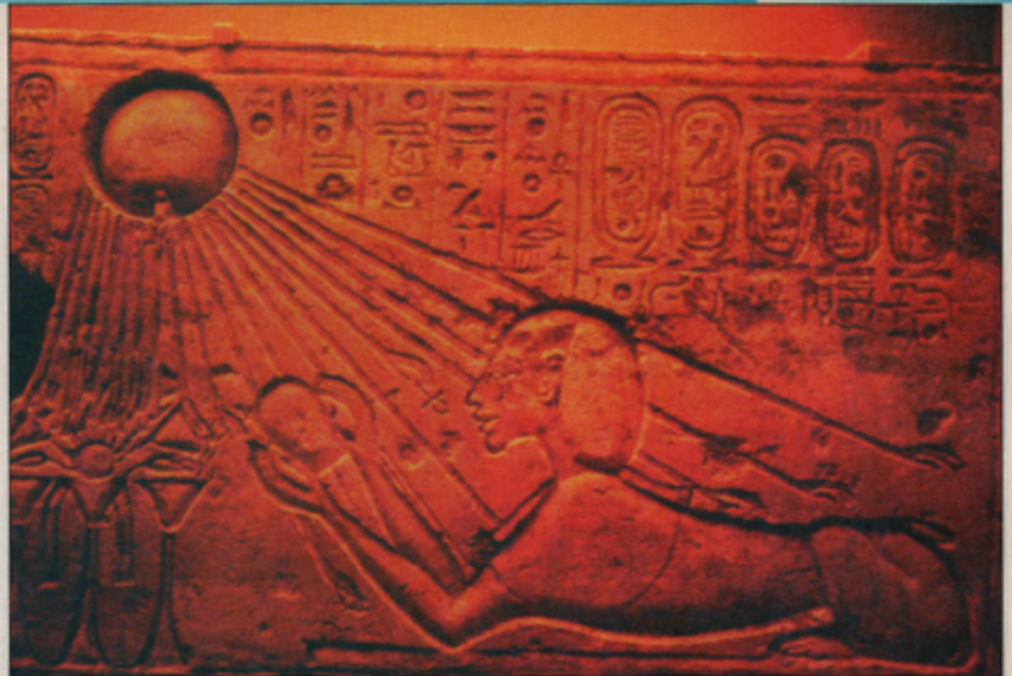
Az örökké égő magtűz

A bizonyoságtáblás űs nem más volt, mint Elek-űr-űs. Elsőként a kárpáti magyarokat hozta magával a Földre, majd a másodszeri eljövetelekor; a későbbi időkben pedig az egyiptomi magyarokat. Vallása a hiszrealita vallás volt, illetve a hitrealita, azaz realista hitű visszolvasattal, ahogy a gúlafali írásoknál szokás. Elek űr-űs távozását követően nem sokkal egy bizonyoságtábla nélküli űr-űs is érkezett a Földre, Khufu vagy a kefe hajú űr-űs személyében, aki a portorkói fajt hozta magával. Khufu leszedette az Elek űs piramisán lévő márványtáblákat, és saját törvényeit kezdte hirdetni az ezt követő időszakban. Azt állította magáról, hogy ő a napisten fia. Tudták róla azonban, hogy ő valójában egy bizonyoságtábla nélküli űr-űs, aki egy új vallással, a napisten vallással a maga uralmát akarta biztosítani a Földön. Az ősi magyar nyelvben a nap neve árh = űr-hő volt, aminek a fordított olvasata h-rá lett, azaz rá, így Khufu-t a napfia, azaz fiará vagy fáraóként ismerték. A fáraó megnevezés te-